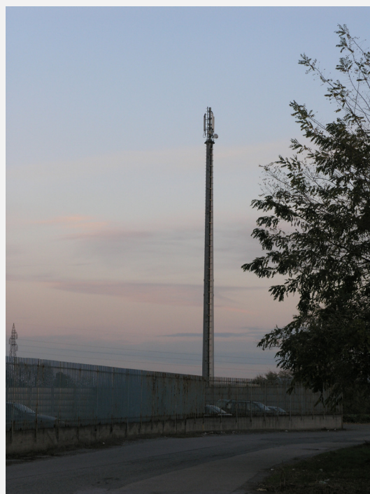
Zone Neutre Installazione di antenne su palo e co-siting