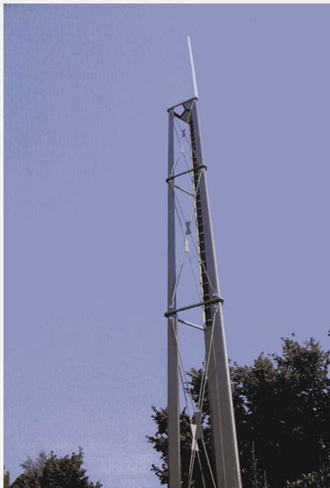
Zone Neutre Installazione di antenne su palo costituente arredo urbano