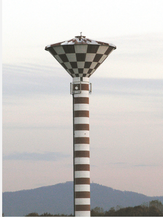
Zone Neutre Installazione di antenne su strutture di sostegno preesistenti