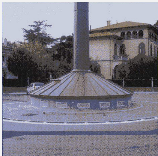
Zone Neutre Shelter mimetizzato