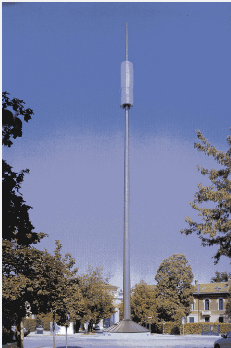
Zone Neutre Installazione di antenne su palo costituente arredo urbano