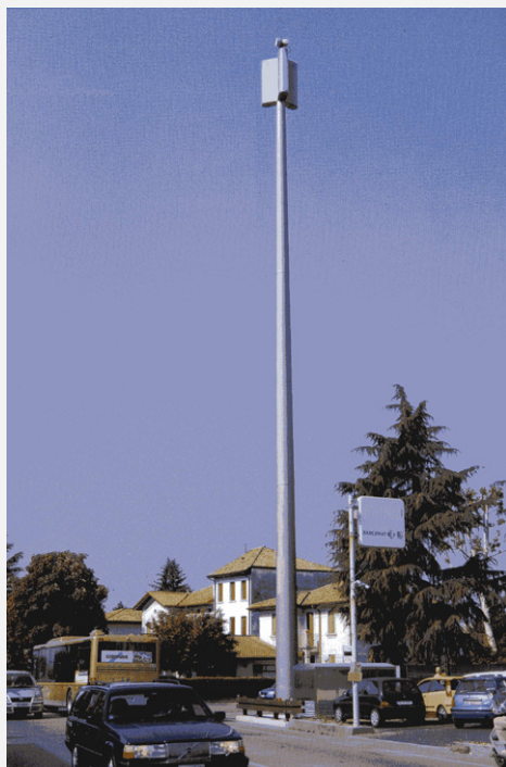
Zone Neutre Installazione di antenne su palo con elementi per la mimetizzazione