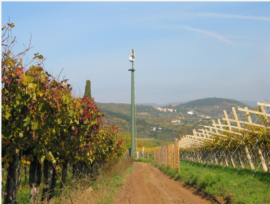
Zone Neutre Installazione di antenne su palo mimetizzato