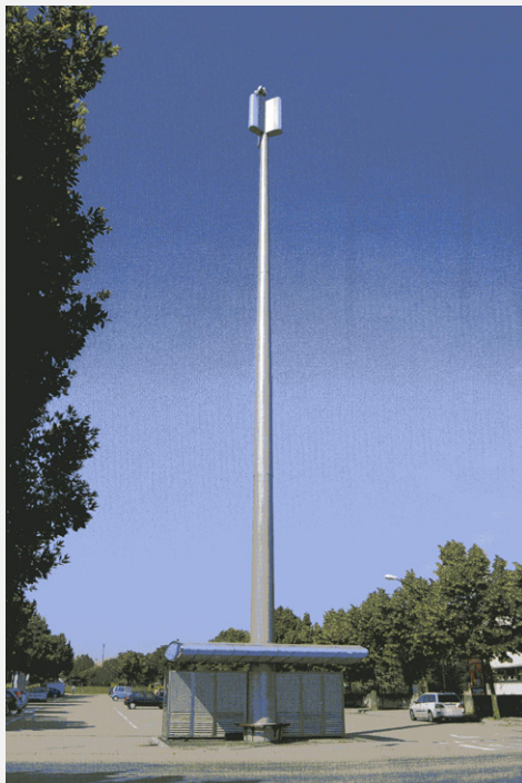
Zone Neutre Installazione di antenne su palo con elementi per la mimetizzazione