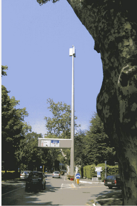
Zone Neutre Installazione di antenne su palo con elementi per la mimetizzazione