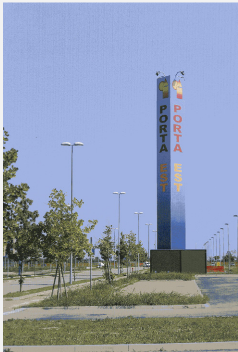
Zone Neutre Installazione di antenne su palo mimetizzato