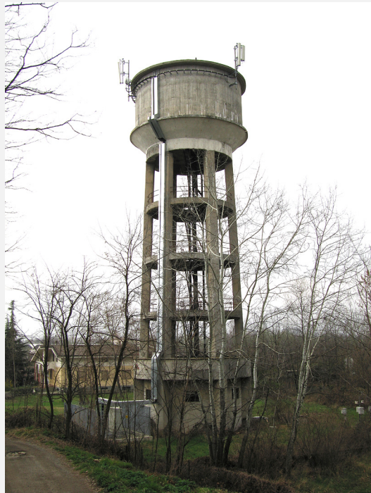
Zone Neutre Installazione di antenne su strutture di sostegno preesistenti